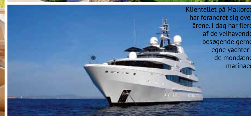
Klientellet på Mallorca har forandret sig over årene. I dag har flere af de velhavende besøgende gerne egne yachter i de mondæne marinaer.