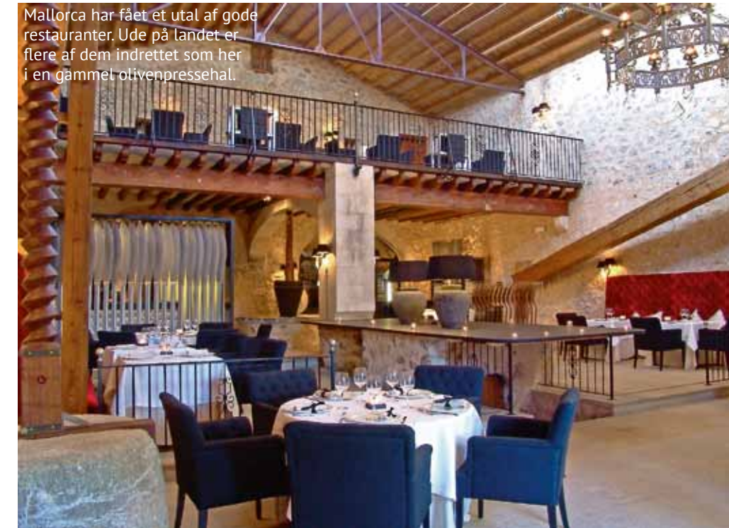
Mallorca har fået et utal af gode restauranter. Ude på landet er flere af dem indrettet som her i en gammel olivenpressehal.