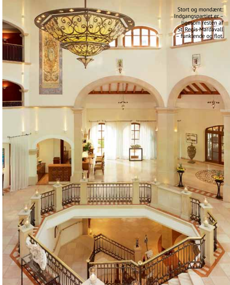
Stort og mondænt: Indgangspartiet er – ligesom resten af St. Regis Mardavall – funklende og flot.