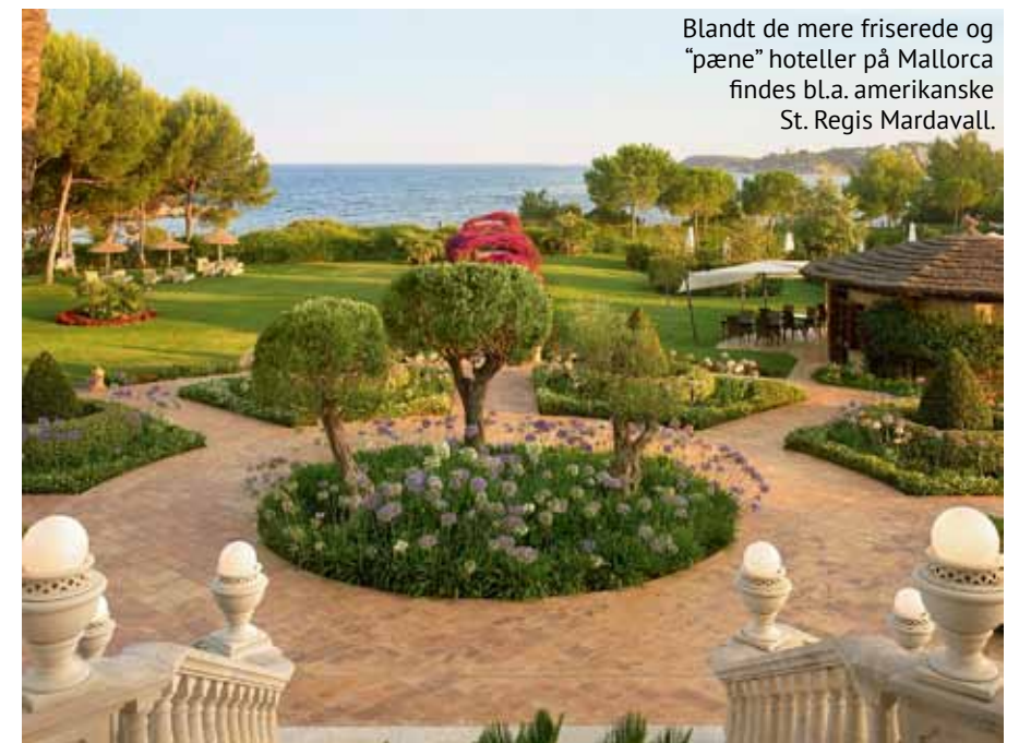
Blandt de mere friserede og "pæne" hoteller på Mallorca findes bl.a. amerikanske St. Regis Mardavall.