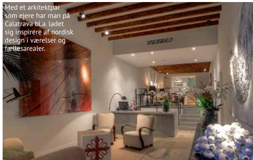
Med et arkitektpar som ejere har man på Calatrava bl.a. ladet sig inspirere af nordisk design i værelser og fællesarealer.

I dag har Son Net 31 værelser, hvoraf de fleste har en betagende udsigt over bjerglandskabet eller ned over skråningen, hvor hotellet igen har etableret vinmarker til egen produktion af vin. I første omgang er det dog et glas Cava, vi nyder ved poolsiden, hvor det eneste minus sådan set er den manglende mobiltelefon-pli. Lidt senere på eftermiddagen pakker vi derfor vores kufferter og hopper ind i den ventende limousine, hvor en uniformklædt chauffør elegant holder døren, så vi kan nyde turen i den hvide Mercedes S-klasse hele vejen ned til næste destination.