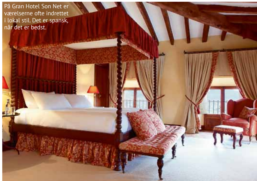
På Gran Hotel Son Net er værelserne ofte indrettet i lokal stil. Det er spansk, når det er bedst.