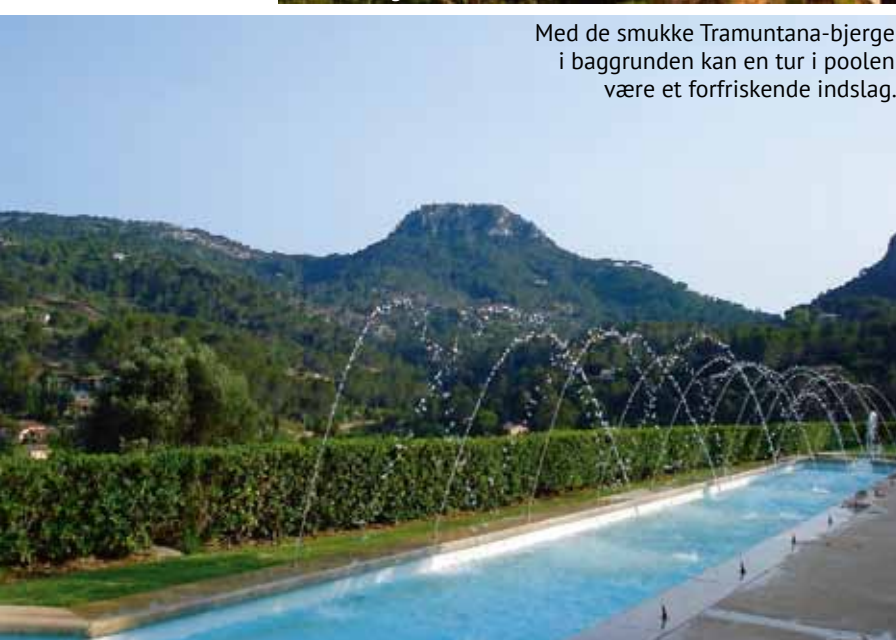
Med de smukke Tramuntana-bjerge i baggrunden kan en tur i poolen være et forfriskende indslag.