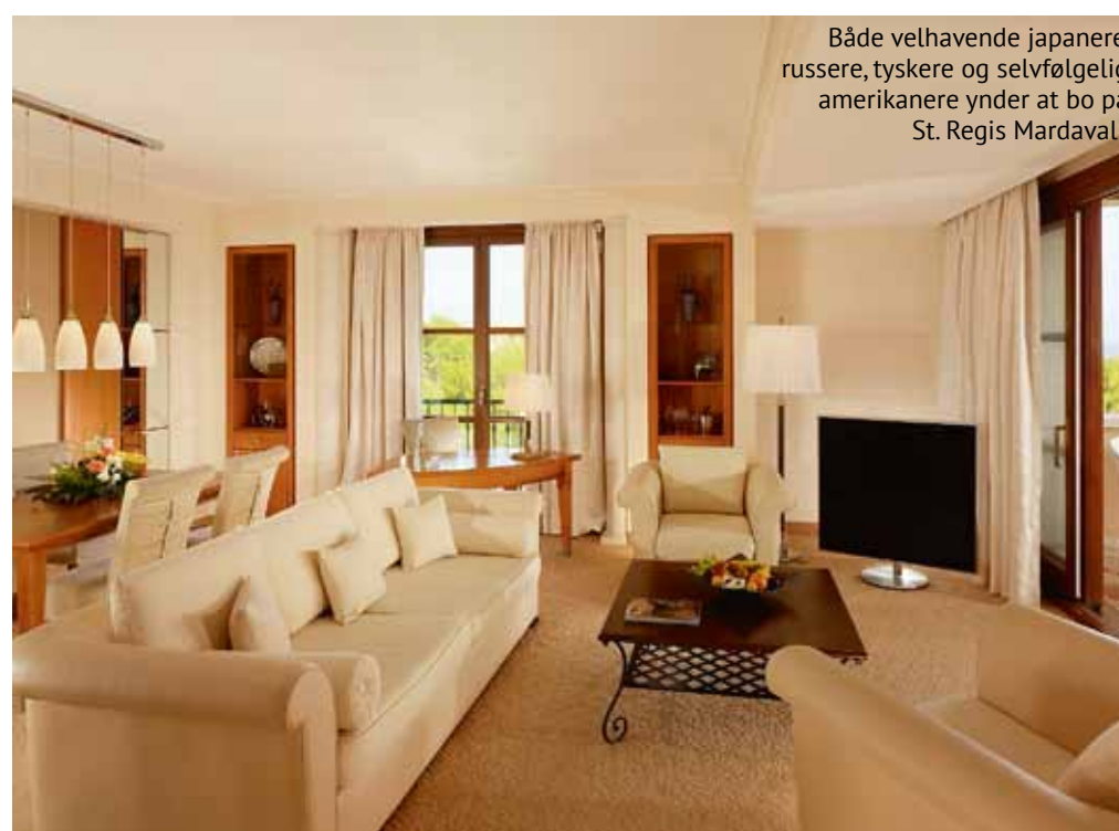
Både velhavende japanere, russere, tyskere og selvfølgelig amerikanere ynder at bo på St. Regis Mardavall.