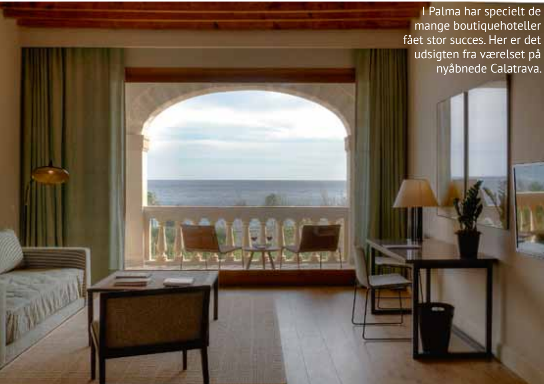
I Palma har specielt de mange boutiquehoteller fået stor succes. Her er det udsigten fra værelset på nyåbnede Calatrava.