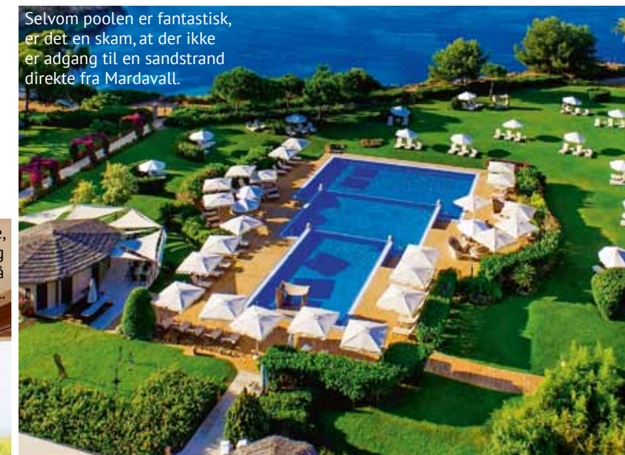
Selvom poolen er fantastisk, er det en skam, at der ikke er adgang til en sandstrand direkte fra Mardavall.